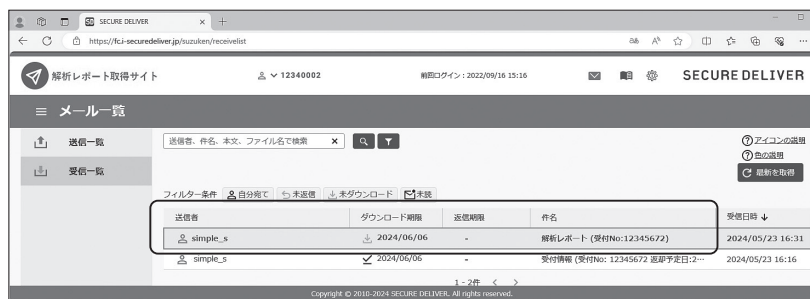
メール一覧画面 (解析終了時)

⑤解析が終了するとメール一覧画面にデータ (件名：解析レポート) が表示されます。ここでデータをダブルクリックしてください。