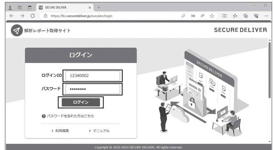
解析レポート取得サイト ログイン画面

②簡易ガイドに貼り付けてあるログイン ID・パスワード情報を使用して解析レポート取得サイトにログインしてください。